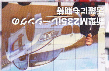
新型M235iレースカーの活躍にも期待